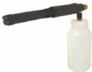
Lance mousse avec réservoir 1L