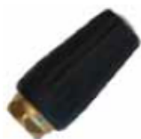
Buse jet rotatif