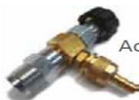
Accessoire produit moussant avec raccord rapide